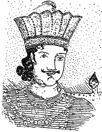
वाजिद अली शाह 'अख्तर'